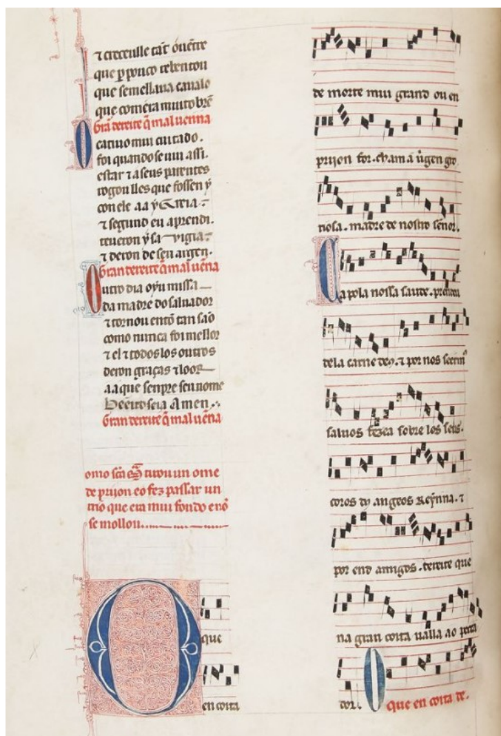
Cantiga 245 no Códice de los Músicos

Salvador da Torre, 7 na margem direita do Lima, a Virgem Maria era invocada numa capela aonde frequentemente ocorria um homem, seu especial devoto, que costumava visitar a capela e oferecer-lhe flores.