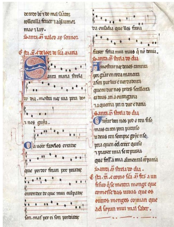
Cantiga 100 no Códice Rico do Escorial

É precisamente à volta das narrativas de milagres que a Virgem Maria terá realizado e em agradecimento pelos mesmos, que surge um estilo de composição que haveria de continuar a povoar, pelos tempos fora, quer o imaginário popular quer o património iconográfico de muitos santuários.